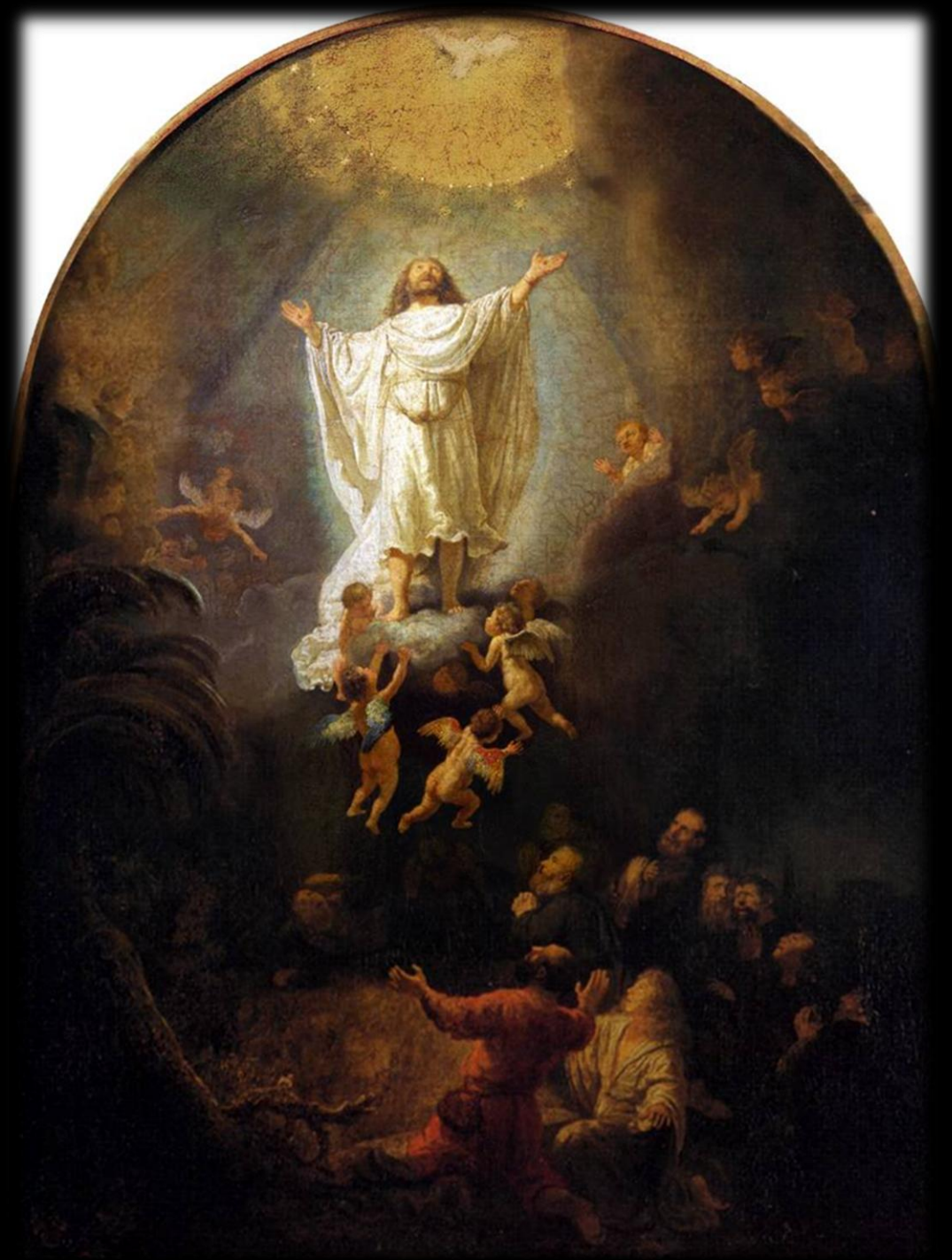
Ascensione del Signore, Rembrandt, Pinacoteca Monaco

Rimaniamo fedeli alla parola del Signore, per non arrossire confusi quando ritornerà.