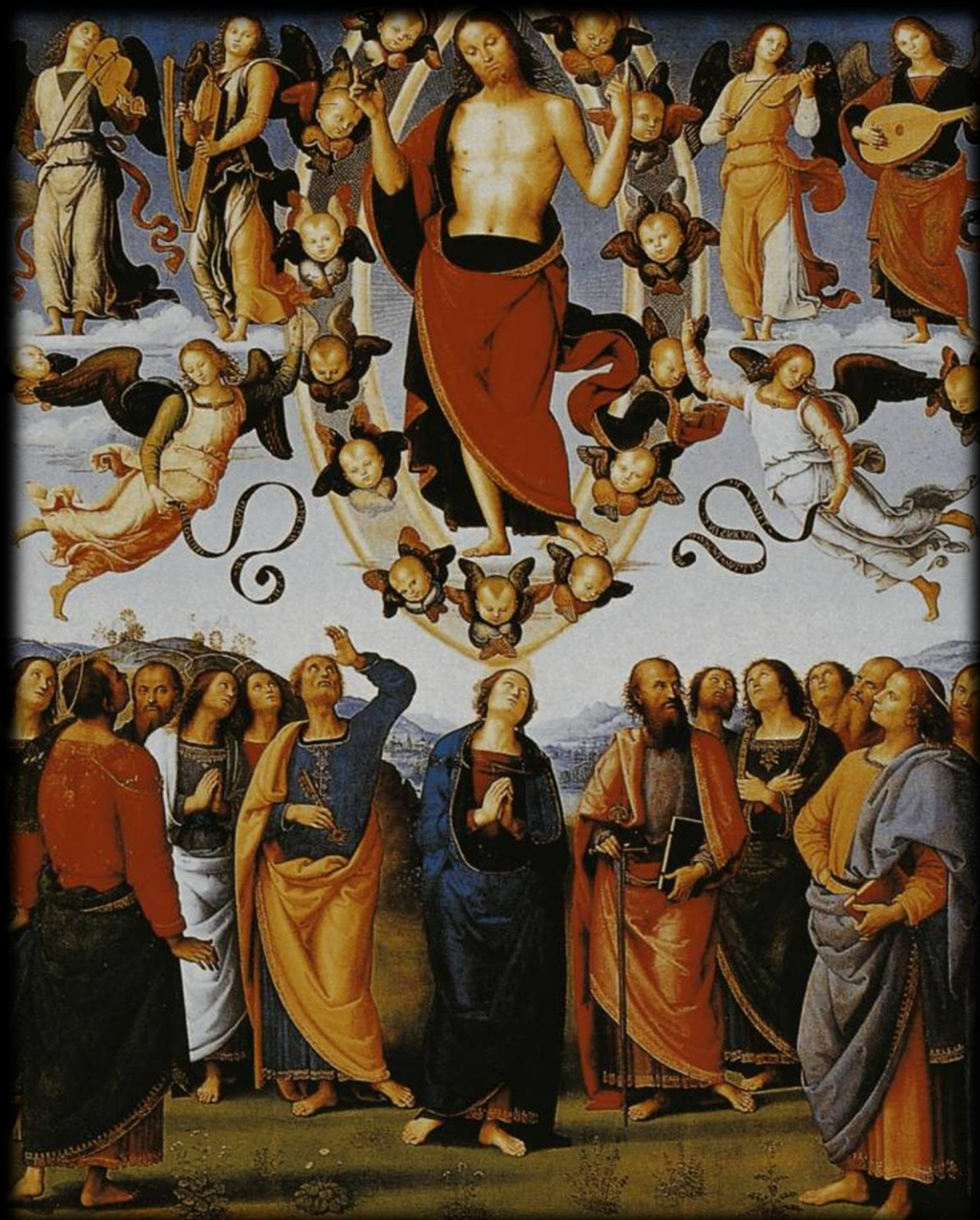
Ascensione del Signore, Pietro Perugino

Quindi i discepoli furono inviati ovunque, con la testimonianza di prodigi e segni miracolosi, perché si credesse che riferivano ciò che essi stessi avevano visto.