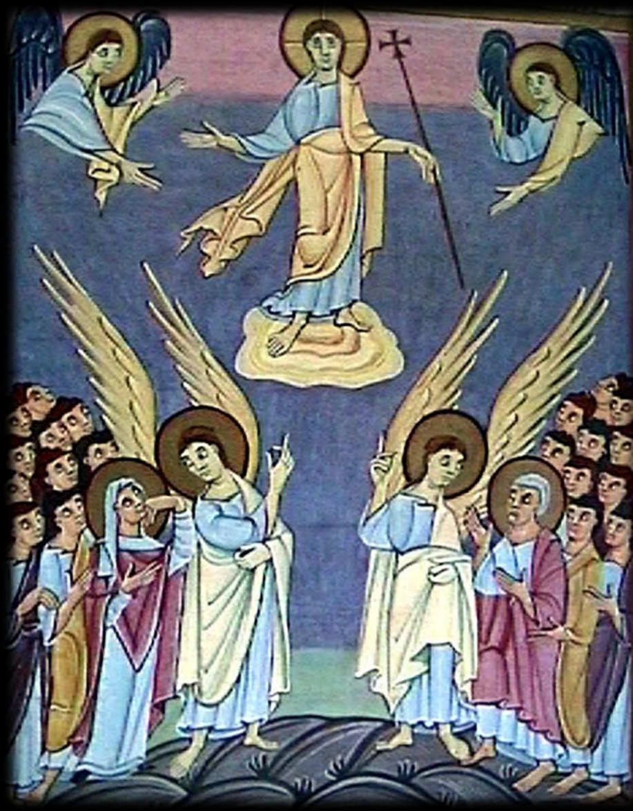
Ascensione del Signore, Evangelario di Bamberg, XI sec.

Questi saranno i segni che accompagneranno quelli che credono: nel mio nome scacceranno demòni, parleranno lingue nuove, prenderanno in mano serpenti e, se berranno qualche veleno, non recherà loro danno; imporranno le mani ai malati e questi guariranno».